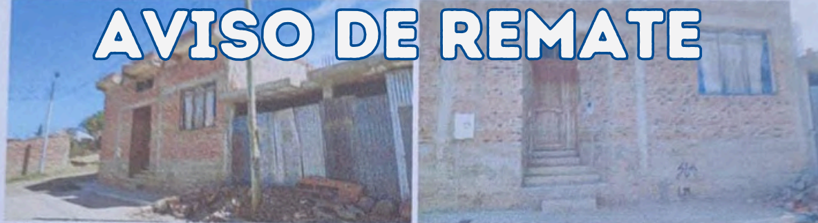
FOT. N° 3 Y N° 4. DETALLE CONSTRUCTIVO EXTERIOR Y ESTADO DEL INMUEBLE OBJETO DE LA LITIS. BLOQUE A.