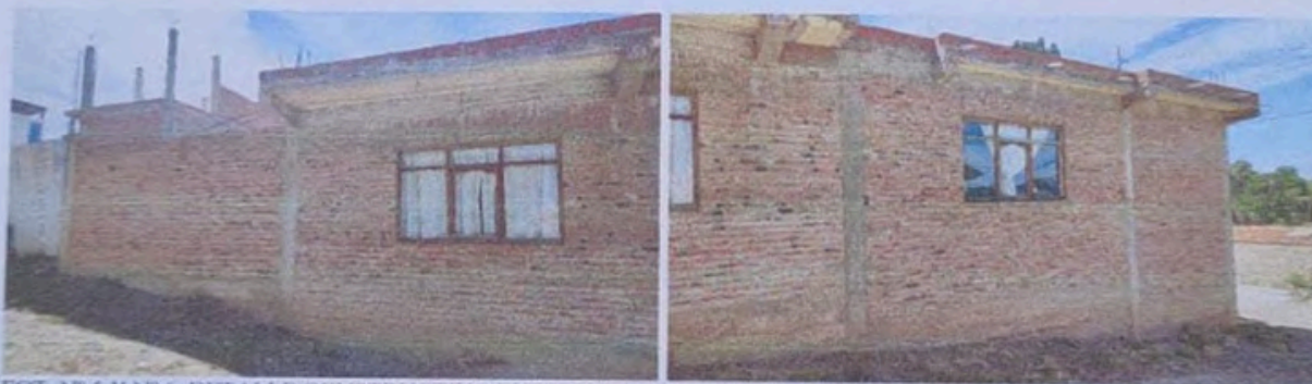
FOT. N° 5 Y N° 6. DETALLE CONSTRUCTIVO EXTERIOR Y ESTADO DEL INMUEBLE OBJETO DE LA LITIS. BLOQUE A.