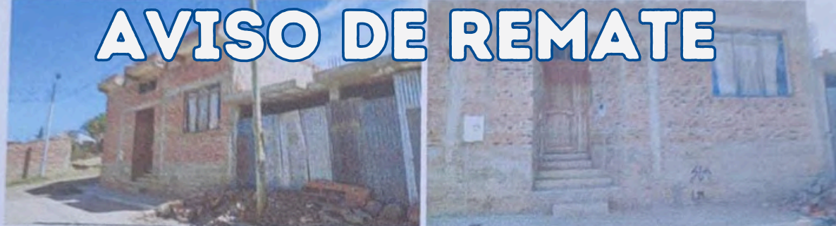
FOT. N° 3 Y N° 4. DETALLE CONSTRUCTIVO EXTERIOR Y ESTADO DEL INMUEBLE OBJETO DE LA LITIS. BLOQUE A.